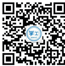
哈理工学工官方微信公众平台二维码