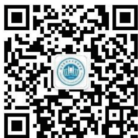
哈尔滨理工大学图书馆 官方微信公众号二维码

新生同学可通过关注哈尔滨理工大学图书馆官方微信公众号、微博或登陆网站，获取图书馆馆藏资源分布、座位设置等详细信息，也可通过图书馆官方微信公众号就具体问题进行线上咨询。