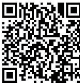
哈尔滨理工大学图书馆 官方微博二维码

哈尔滨理工大学图书馆官方网址： http://lib.hrbust.edu.cn/