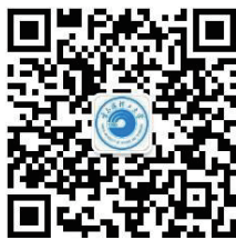
哈尔滨理工大学官方微信公共平台二维码

※ 请各位家长、同学们扫描关注哈尔滨理工大学学生工作部（处）微信公众平台——“哈理工学工”，我们将在新生报到前在微信公众平台推送新生来校（各校区）报到的参考交通路线、各学院辅导员办公地点及联系方式、2024 级新生班级、最新通知等信息（二维码如下）。