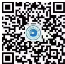
哈尔滨理工大学 官方微信公众号

2. 请同学们在微信中搜索并关注“哈尔滨理工大学”和“哈理工学工”官方微信公众号，如有入学安排调整或报到相关信息，学校将会通过以上两个官方公众号及时公布。