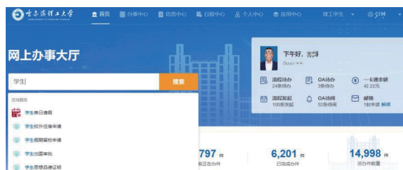
学生办事搜索页面

除办事功能外，办事大厅还集成了信息中心、日程中心，学生可以查看全校各部门的公告通知以及个人的日程。