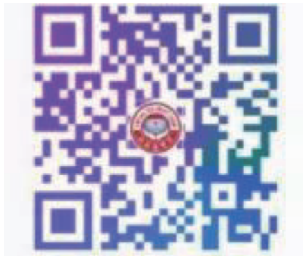
“黑龙江一卡通”公众号（微信号：hljrst）

社保卡办理方法：可通过“黑龙江一卡通”公众号线上申请办理，也可线下任选银行申请办理（办卡网点及关于社保卡政策更多信息，详见“黑龙江一卡通”公众号）。