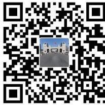
哈理工全景校园二维码